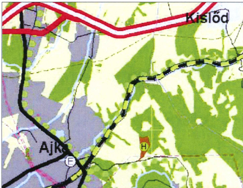
Veszprém Megye Területrendezési Terve kivágat Ajka város közigazgatási területén beillesztett térségi hulladéklerakó helyel.